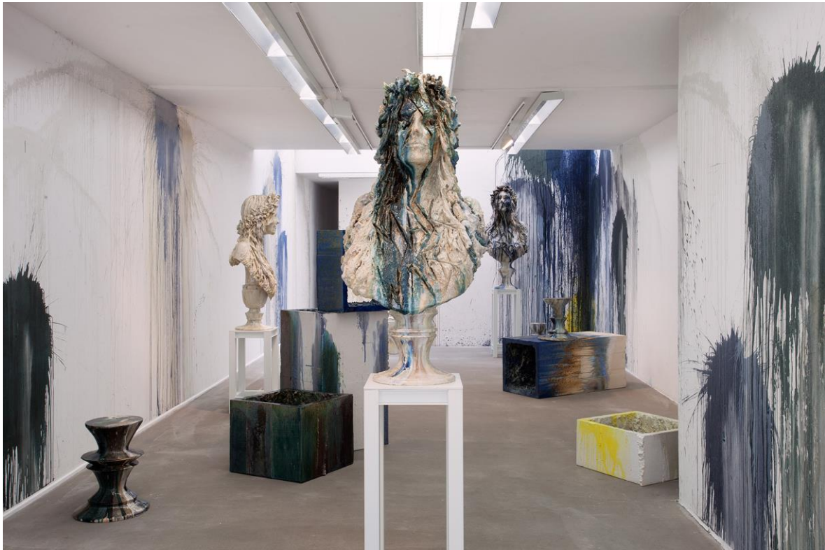
Zaaloverzicht Anne Wenzel, 'I can't believe I still have to protest this shit', 2018