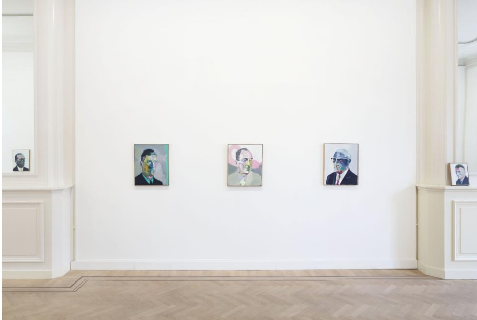
Zaaloverzicht Alex van Warmerdam, 'Tronies', foto: Sonia Mangiapane, via GRIMM Keizersgracht, Amsterdam