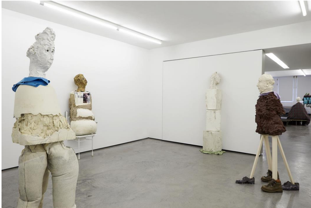
Zaaloverzicht 'Parts, Bits & Pieces'